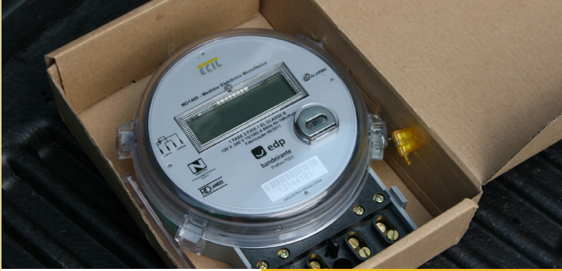
Instalação do 1º Medidor no Inovcity