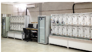
Laboratório de Calibração de Medidores