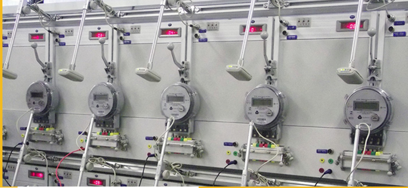
Laboratório de Calibração de Medidores